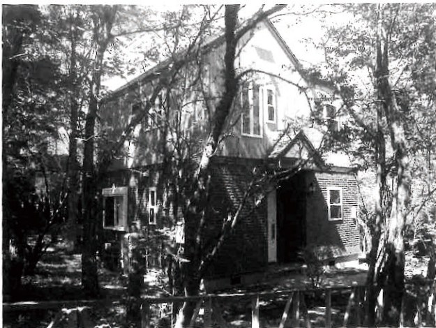
見る人の心をとらえる美しいログハウス